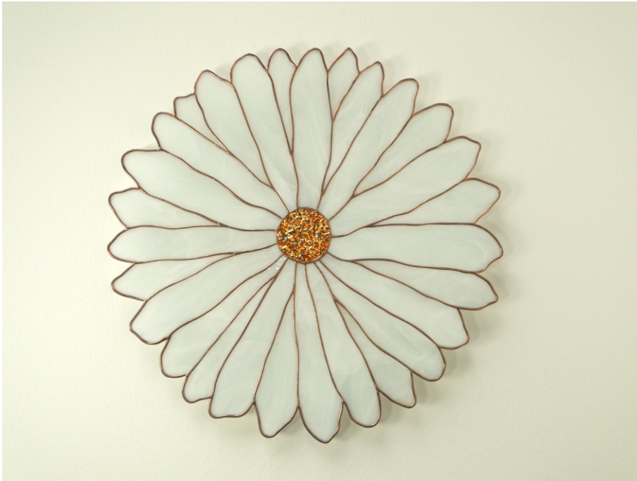
Raumgestaltung " Daisy - Margerite "