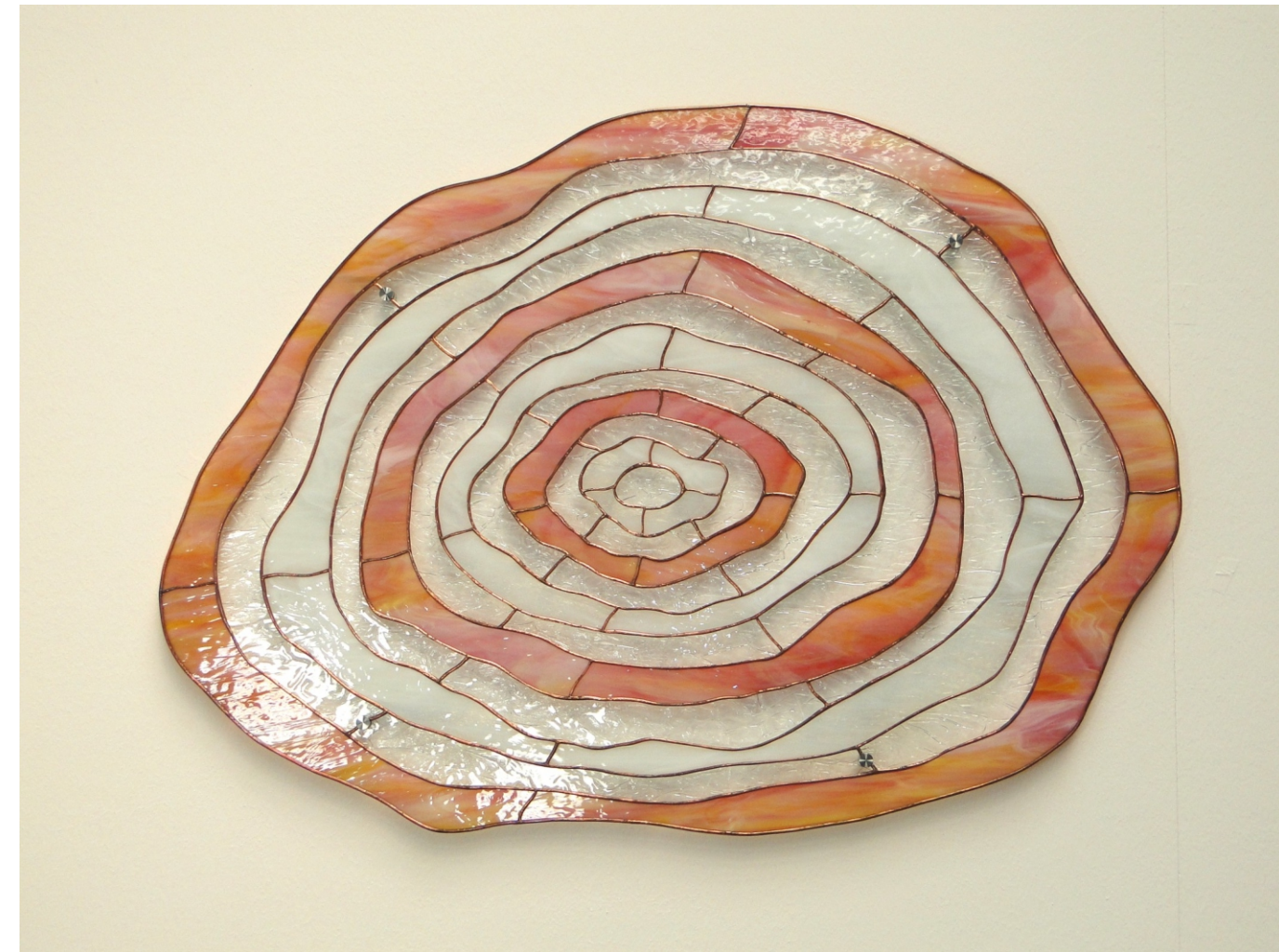
Raumgestaltung " Growth Rings - Jahresringe " ca. 101 x 72 cm