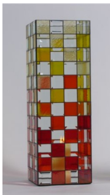
“ Feuer und Flamme “

96 Facetten/Bevels 51 x 51 mm ( 2" x 2" ) Artikelnummer 85 130 02