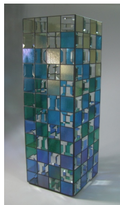
“ Caribbean Flair “

96 Facetten/Bevels 51 x 51 mm ( 2" x 2" ) Artikelnummer 85 130 02